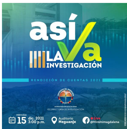
Ilustración 3: recurso grafico