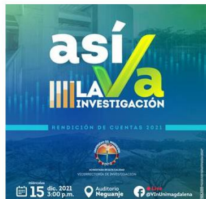
Ilustración 2: Invitación por correo institucional

Con atento saludo le invitamos a la presentación de la rendición de cuentas de la vigencia 2021 de la Vicerrectoría de Investigación, a realizarse el día miércoles 15 de diciembre de 2021 a las 3:00 p.m., la cual se realizará en el Auditorio Neguanje y será transmitida por la plataforma Facebook live de la Vicerrectoría de Investigación.