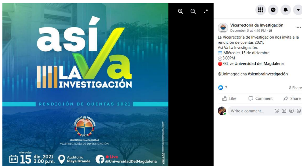
Ilustración 1: publicación de invitación por página Facebook

Publicación de invitación en redes sociales y correo Institucional: